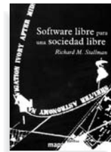
Ed.: Traficantes de Sueños Precio: 12 euros 320 páginas, 2004

Un libro asequible, porque no sólo se dirige a gente ya familiarizada con el tema, y que reúne una serie de documentos, conferencias y textos elaborados por uno de los gurús de la informática más ética y comprometida, y que trabaja incansablemente por fomentarla. La editorial Traficantes de Sueños recoge así la historia, el significado y la lucha del movimiento del software libre.