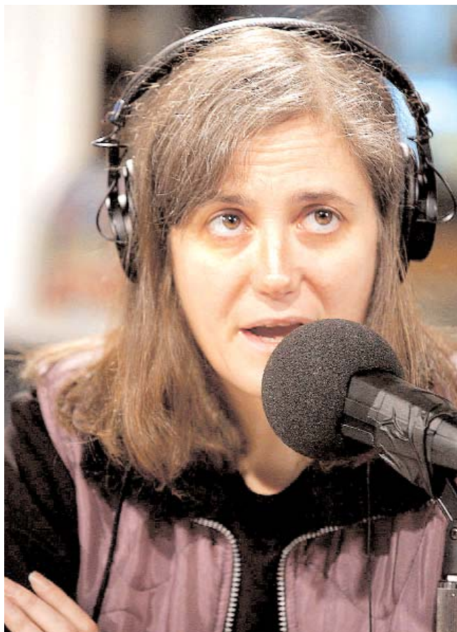
EN EL AIRE. La periodista, al micrófono durante el programa de radio.

El equipo de reporteros independientes que se ha servido de una independencia poco vista en el mundo del periodismo norteamericano, ha logrado crear uno de los programas de radio y televisión más influyentes del país. Democracy Now! pertenece a la red de Pacífica Radio, que lleva más de medio siglo emitiendo las voces de la disidencia. En los últimos años el programa dio el salto a la televisión, asociándose con las televisiones comunitarias del país.