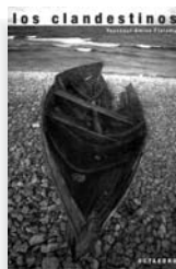
Editorial: Octaedro Precio: 7,80 euros 126 páginas, 2003

Juegos y variaciones en la longitud de capítulos y frases. Saltos en el tiempo. Mezcla de sentimientos y cotidianeidad. Pluralidad de personajes, de abordajes —la madre, la amante, un fotógrafo, etc.—. Diferentes perspectivas —el omnipotente narrador (se tiene la impresión de estar oyendo a un cuentista relatar más que a un autor escribiendo) y parte de los embarcados—. Dominio del lenguaje, habilidad y recursos narrativos. Todo ello permite que el relato, durísimo y que llega directo al corazón, se haga soportable. Sin dejar de denunciar lo absurdo: ¿qué justifica unas muertes tan cotidianas y tan sinsentido?