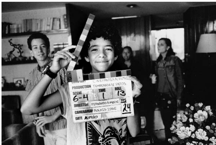
Temporada de patos

En definitiva, poco sobre la realidad cubana y mucho show de preguntas y respuestas entre Stone y Castro. (Aún así, este documental no ha conseguido estrenarse en EE UU, donde parece que por el mero hecho de haber realizado un filme sobre Cuba ya se es sospechoso.