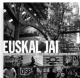
Ed.: Eguzki Bideoak Precio: 10 euros (15 euros, con CD) 86 páginas, 2004

Lo que nos lleva a la última parte del libro: las ocupaciones se multiplican por la zona, la desobediencia se contagia. ¿Quién dijo que ese movimiento estaba moribundo?