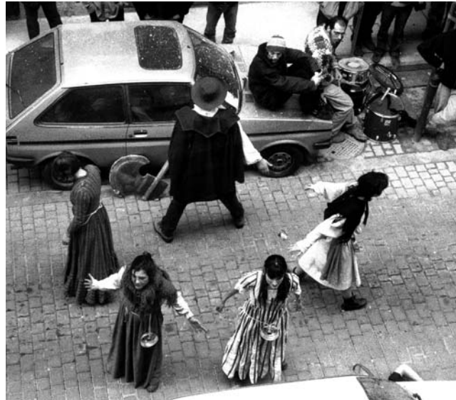
TEATRO FORO. Esta corriente fue desarrollada por el dramaturgo brasileño Augusto Boal en los años 60.

El equipo actoral que interpreta la situación inicial, previos ensayos, debe presentar el espectáculo con una calidad estética que estimule la acción de las personas que miran. Mucho más importante que llegar a una buena solución es provocar el debate. El Teatro Foro no termina nunca, porque todo lo que en él ocurre se extrapola a la propia vida. En el primer acto, los artistas muestran su visión del mundo y, en el segundo, el público puede in-