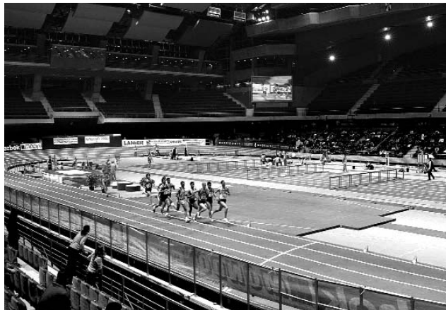
PALACIO DE LOS DEPORTES. Campeonato de España Junior de atletismo celebrado a finales de febrero.

En el terreno medioambiental, la nueva construcción ha