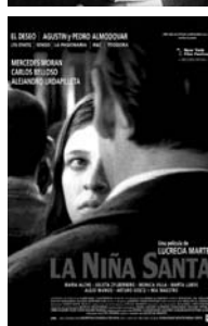
De arriba a abajo, imágenes de "Temporada de patos", "Whisky" y cartel de "La niña santa".

de encuadres enigmáticos, diálogos que dicen mucho más de lo que aparentan, y miradas y gestos inquietantes. Una película que crea con maestría atmósferas opresivas y densas, hasta el punto de que se siente casi físicamente el peso opresor de la moral cristiana y provinciana.