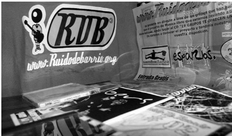
CENTRO SOCIAL LA PILUKA DE MADRID, en el que el colectivo Ruido de Barrio se reúne y participa.

Al año siguiente, RDB comienza a coordinarse con otros colectivos y personas que también trabajan en el círculo de la libre difusión del arte, la música y la cultura. A